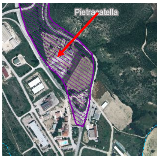
Stralcio Geoportale MASE